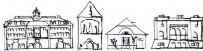
FÖRDERVEREIN FREUNDE DES THÜRINGER MUSEUMS EISENACH E.V.