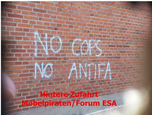
Hintere Zufahrt Möbelpiraten/Forum ESA