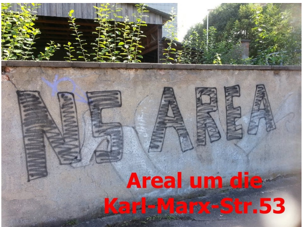
Areal um die Karl-Marx-Str.53