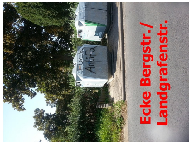
Ecke Bergstr./ Landgrafenstr.