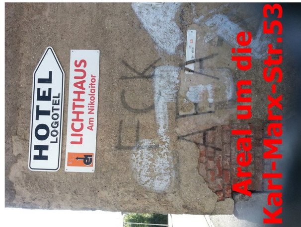
Areal um die Karl-Marx-Str.53