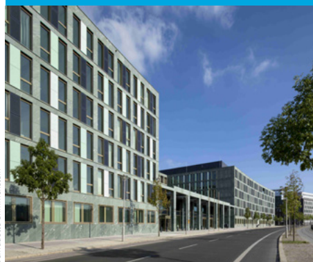
Bernsdorfer Gärten Göttingen

Projektsteuerung, wirtschaftliche Beratung, Begleitung des europaweiten Vergabeverfahrens sowie Controlling während der Bauausführung für den Neubau des Berliner Dienstortes des Bundesministeriums für Bildung und Forschung