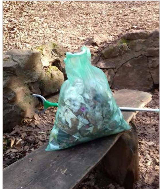
Typischer „Sammelerfolg“ nach Komplettreinigung der Drachenschlucht: ca. 30l Müll

Zusätzlich dazu erfolgten nahezu wöchentliche Reinigungen der Eingangsbereiche der Drachenschlucht und der Landgrafenschlucht: 5 - 8 Liter Müll pro Einsatz. Im Jahr 2018 war das bereits ähnlich.