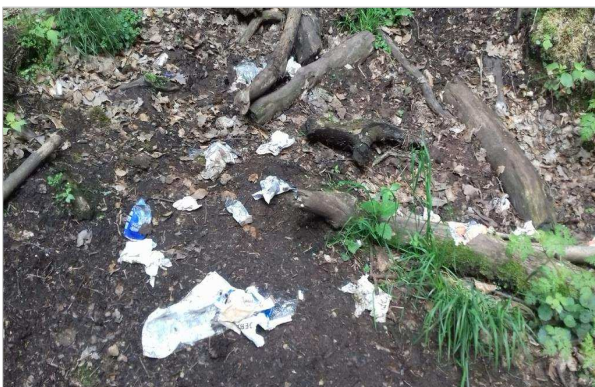
Bild einer Müll-Ecke, stellvertretend für einige Bereiche der Drachenschlucht

Deutlich wird das beispielsweise an der Müllproblematik. In der Hauptwanderzeit zwischen Frühjahr und Herbst 2019 hat die ehrenamtliche Initiative 15 Reinigungseinsätze (das entspricht einem Intervall von 2-3 Wochen) durch die komplette Drachenschlucht durchgeführt. Das Ergebnis waren 15 - 30 Liter Müll, in komprimierter Form - wohlbermerkt pro Einsatz auf einer Wegstrecke von nur 3 Kilometern!