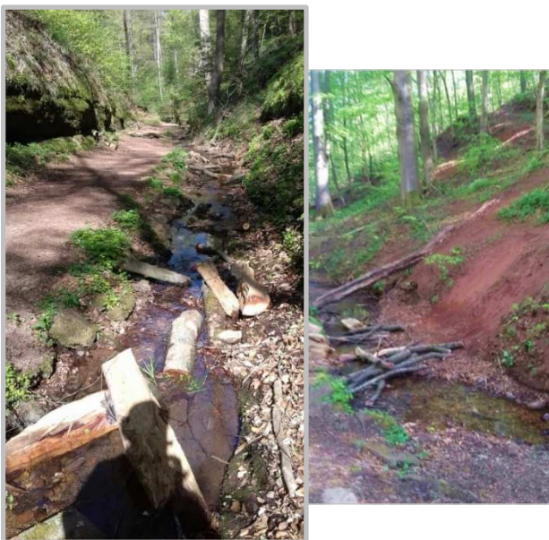
künstlich angelegte Bachquerungen aus Totholz, Bild rechts mit Erosionsschäden

Mit den steigenden Besuchszahlen nimmt jedoch die menschengemachte Gefährdung der Drachenschlucht dramatisch zu. So wächst zum einen der Anteil der Menschen, die bewusst keine oder nur mangelnde Wert-