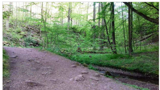
„möglicher Standort“ des Drachenhauses

Am nächsten Morgen machen wir uns auf die Socken, mit etwas Proviant und viel Neugier. Das Auto stellen wir auf dem Wanderparkplatz an der Phantasie ab, es ist 8:30 Uhr, der Parkplatz fast noch leer, die Sonne scheint durch das Blätterdach, die Luft ist noch frisch. Es ist ein schöner Morgen. Wir laufen die Wichmann-Promenade entlang Richtung Drachenschlucht und erreichen das Drachentportal nach fünfzehn Minuten. Der geschnitzte Drache über unseren Köpfen begrüßt uns wie früher. Das hat sich nicht geändert. Wir gehen ein Stück weiter und erblicken staunend ein kleines Häuschen.