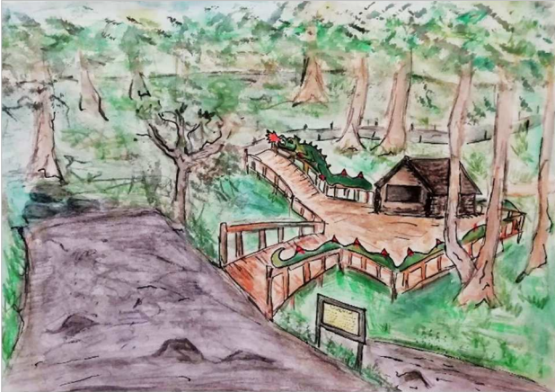
Das Drachenhaus am „möglichen Standort“

Es scheint auch schon jemand darin zu sein. Wir gehen über eine kleine Brücke über den Marienbach und werden von einer jungen Frau und einem etwas älteren Mann freundlich begrüßt. Da wird uns schnell klar, die erste Veränderung ist, dass für das Betreten der Drachenschlucht Eintritt zu zahlen ist.