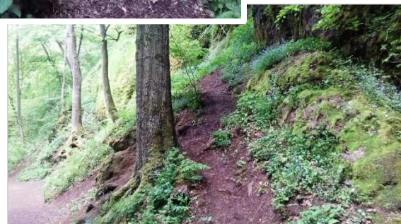
Kletterstelle (Bild oben) und Trampelpfad auf zum Teil sensiblen Böschungsbereichen mit starken Erosionsschäden