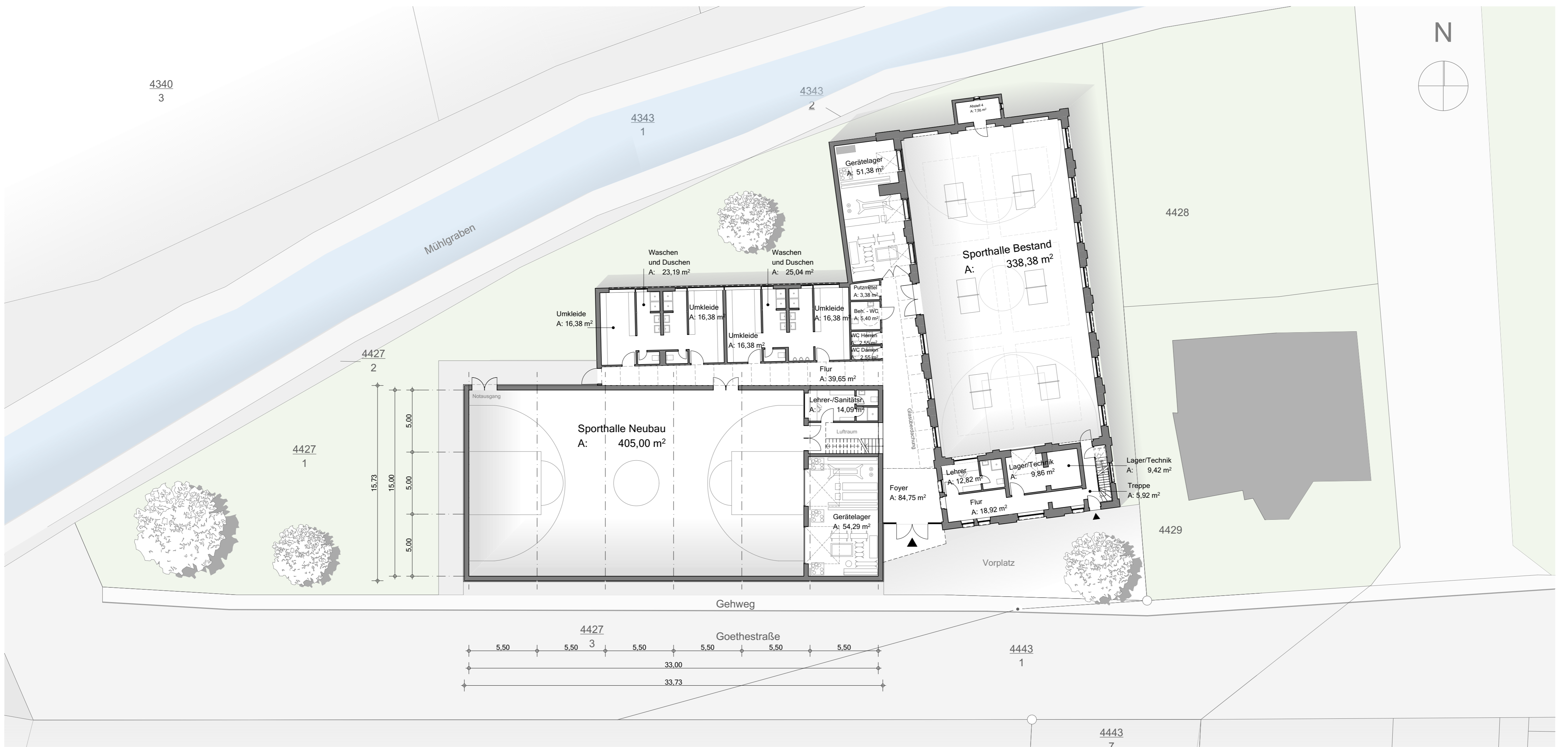
Grundriss Erdgeschoss M1:200

Die Fassaden des Erweiterungsgebäudes nehmen ausdrücklich Bezug auf das ehrwürdige Bestandsgebäude, indem als Außenhaut ebenfalls ein ziegelroter Klinker geplant ist. Nach oben hin löst sich die Fassade in ein umlaufendes Fensterband auf, das die neue Halle mit ausreichend Tageslicht versorgen und dem Gebäude einen leichten oberen Abschluss verleihen soll. Die Verbindung zwischen Alt und Neu schafft das niedrigere Foyer, das im Inneren auch die unveränderte historische Ziegelfassade des Bestandsgebäudes preisgibt. Der Neubau ordnet sich in seiner Höhe der alten Sporthalle unter und unterstreicht mit seiner Fassadengestaltung und Höhenstaffelung die Wirkung des historischen Altbaus, ohne hiermit in Konkurrenz zu treten.