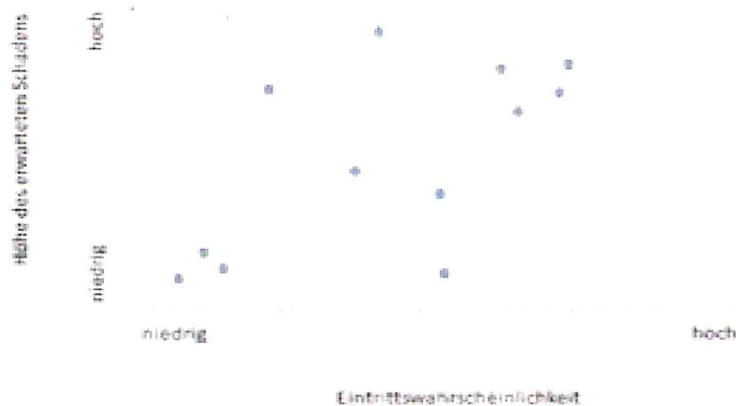
Abbildung 2 Risikomatrix

Die Punkte in der Matrix symbolisieren unterschiedliche Risiken. Für Risiken mit hoher Eintrittswahrscheinlichkeit und hoher Schadensermwartung (z. B. Umsätze in der Betreuung eines Ski-Lifts gehen nicht in die Steuererklärung ein) sind primär Maßnahmen zu entwickeln. Für Risiken mit niedriger Eintrittswahrscheinlichkeit und niedrigem erwartbarem Schaden sollten die Kommunen weniger Zeit aufwenden.